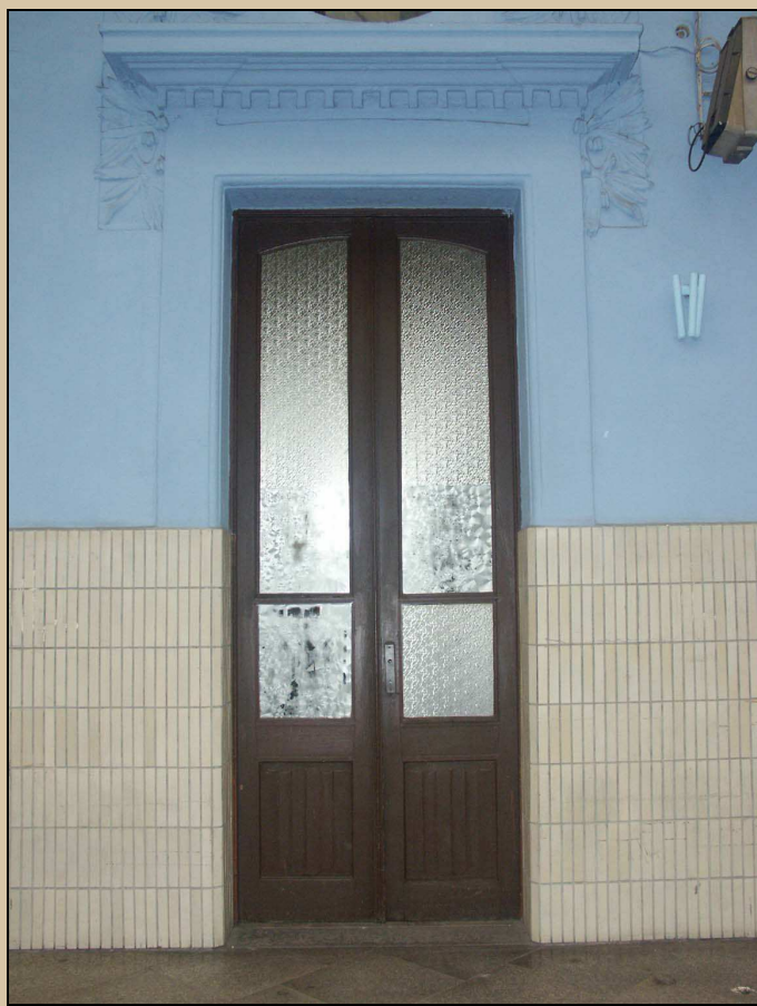
pohled na dveře z perónu