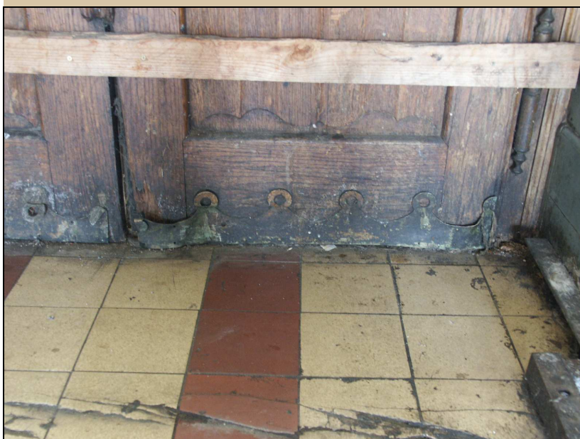
detaily dveřního křídla, dveřní závěs s ozdobnými konci, okopný plech s vlnkovým motivem, kazety s vlnkovým ukončením