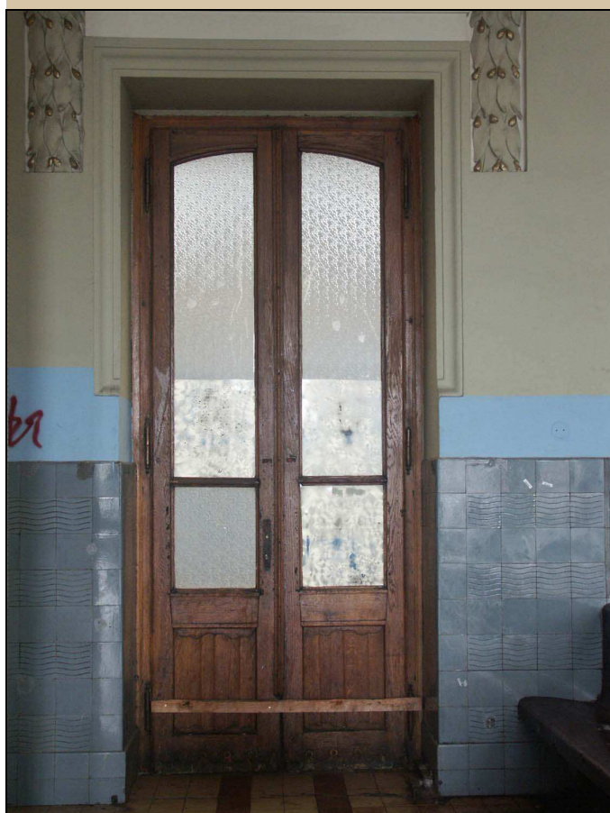
pohled na dveře z interiéru